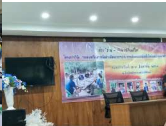
ภาพชุดที่ ๑ แสดงพิธีเปิด กิจกรรมต่าง ๆ ในค่ายกลุ่มนาค