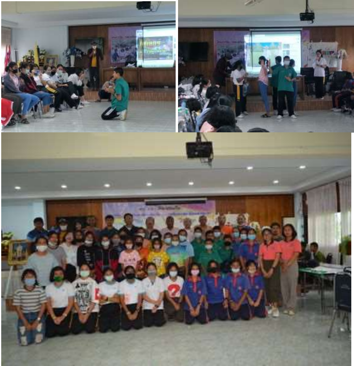
ภาพชุดที่ ๓ แสดงกิจกรรมต่าง ๆ และภาพหมู่สมาชิกค่ายกลุ่มนาค