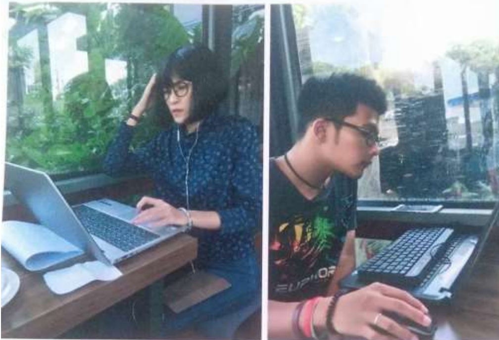
รูปถ่ายการวิจัยและการถอดบทเรียนบางส่วน (๑)