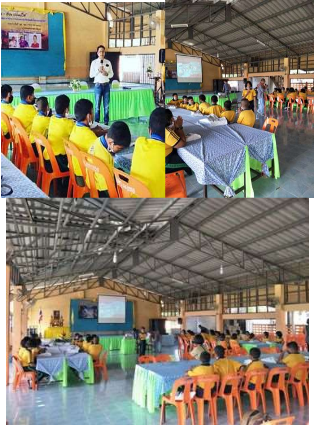
ภาพชุดที่ ๒ แสดงผู้วิจัยพบสมาชิกค่ายกลุ่มคลื่นใหม่และกิจกรรมต่างๆ