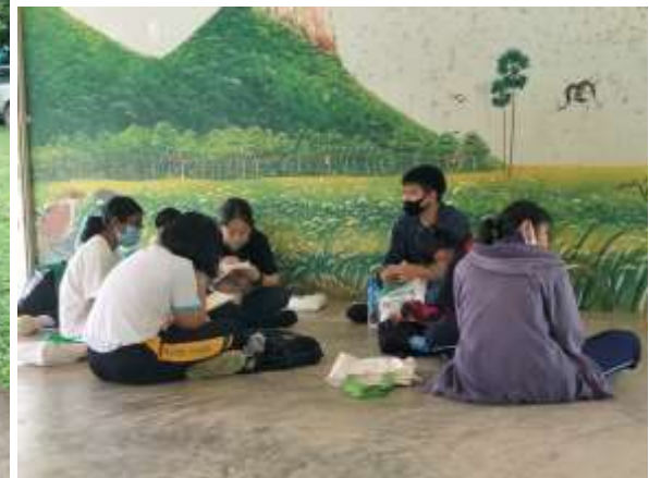
ภาพชุดที่ ๒ แสดงบรรยากาศและกิจกรรมต่างๆในค่ายกลุ่มนาคร