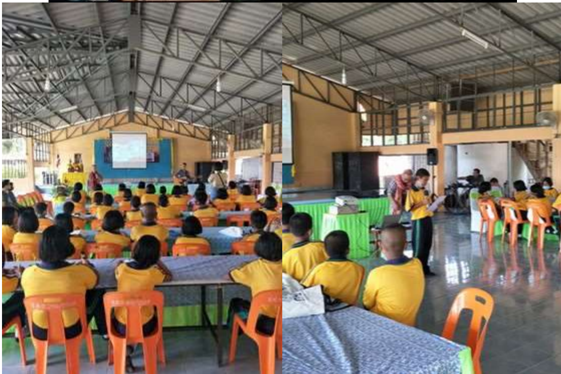
ภาพชุดที่ ๑ แสดงพิธีเปิดและกิจกรรมต่างๆในค่ายกลุ่มคลื่นใหม่