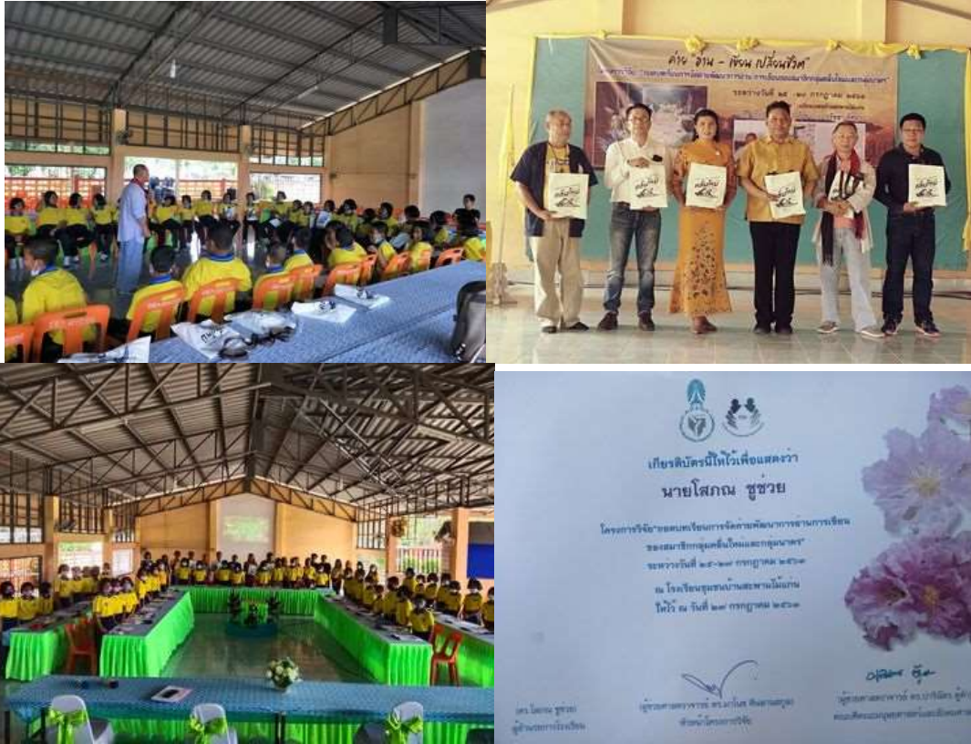
ภาพชุดที่ ๓ แสดงกิจกรรมต่างๆในค่ายฯ วิทยาการและผู้บริหาร พิธีปิด และเกียรติบัตร